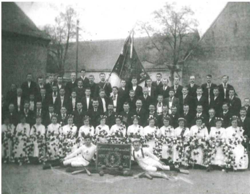
TURNVEREIN ALTRANSTÄDT IM JA HRE 1914

30 JAHRE TSG BLAU WEIS GROßLEHNA 1990 E.V. (SOWIE DEREN VORGÄNGERN)